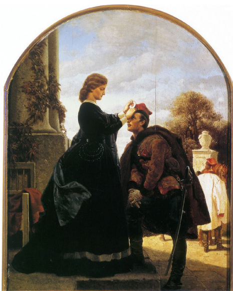
Artur Grottger, Pożegnanie powstańca, domena publiczna

1 ■ Przyjrzyj się obrazowi Artura Grottgera, a następnie odpowiedz na pytania.