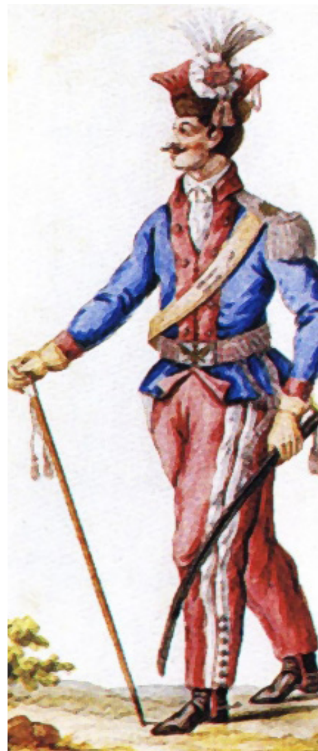
Żołnierz z 1. Wielkopolskiej Brygady Kawalerii Narodowej wg regulaminu z 1790, domena publiczna