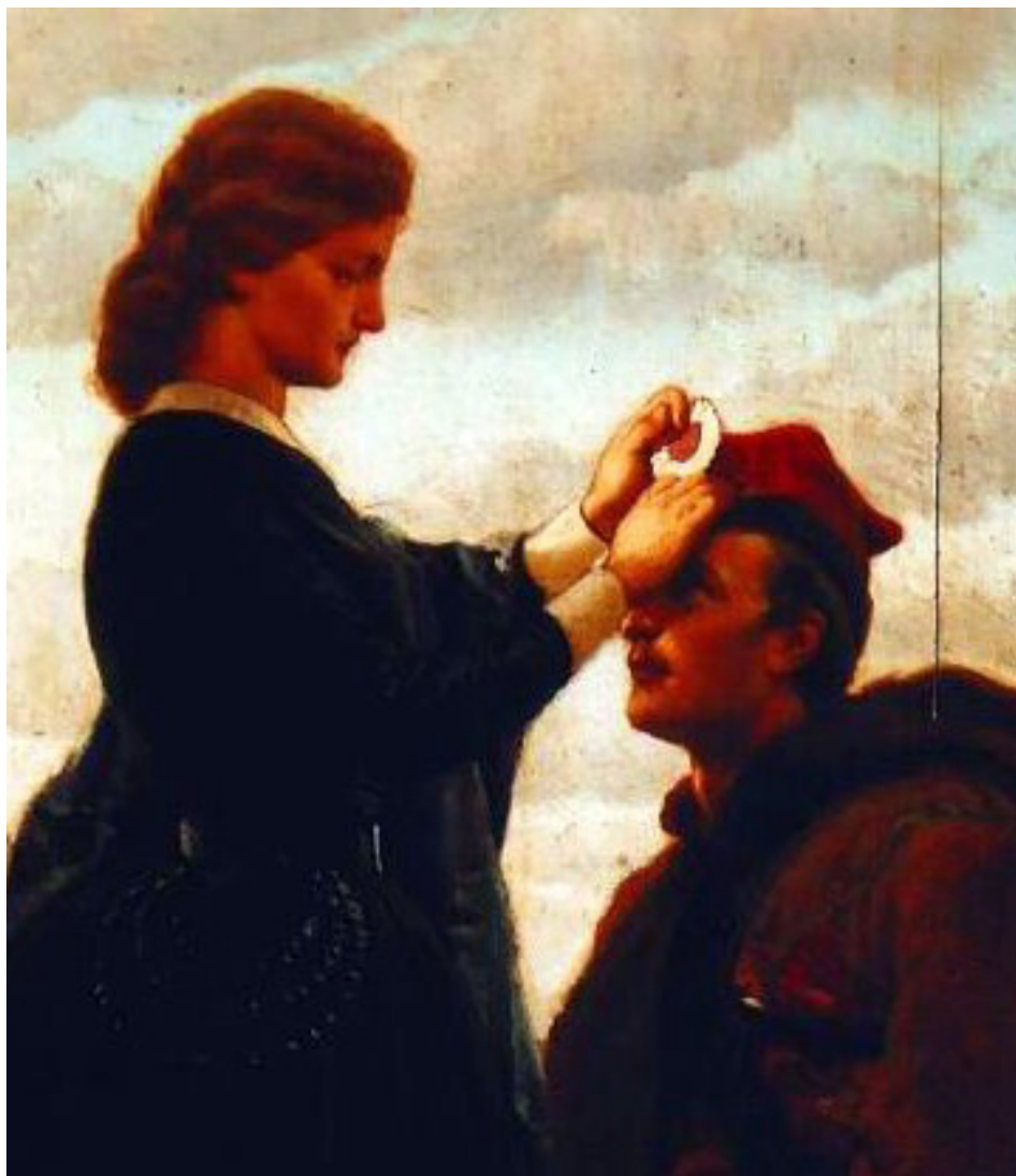
Artur Grottger, Pożegnanie powstańca (fragment obrazu), domena publiczna

2 ■ Zwróć uwagę na nakrycie głowy mężczyzny. Czy wiesz, jak nazywa się ozdoba, którą kobieta przypina do konfederatki?