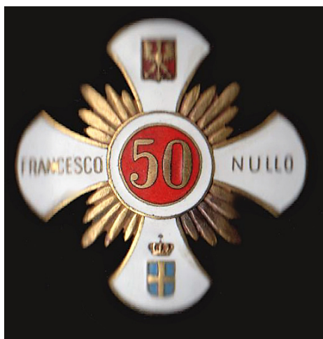
Odznaka pamiątkowa 50. Pułku Piechoty im. Francesco Nullo, wersja oficcerska, domena publiczna

Przyjrzyj się jej i opisz oraz odpowiedz na pytanie: jak myślisz dlaczego pułkownik Francesco Nullo został patronem polskiego pułku?