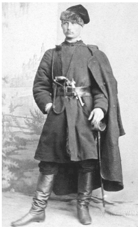
Powstaniec Styczniowy z rewolwerem Lefauchaux, domena publiczna

4. Broń palną możemy podzielić na długą i krótką. W Powstaniu Styczniowym także używano rewolwerów czy pistoletów. Rewolwery były poręczną, praktyczną i skuteczną bronią, a także szybkostrzelną. Jednym z niuansów był brak zapasów amunicji oraz fakt, że załadowany bębenek szybko był wystrzeliwany. Najczęściej używano rewolwerów systemu Lefauchaux produkcji belgijskiej oraz amerykańskich Coltów.