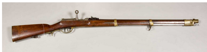
Zündnadelbüchse M/54, pruski karabin iglicowy systemu Dreyse'ego, domena publiczna

1. Z jakiego kraju pochodzi broń znajdująca się na fotografii?