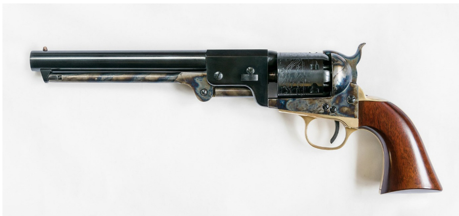
Rewolwer Colt Navy model 1851, replika współczesna, domena publiczna

4. Broń palną możemy podzielić na długą i krótką. W Powstaniu Styczniowym także używano rewolwerów czy pistoletów. Rewolwery były poręczną, praktyczną i skuteczną bronią, a także szybkostrzelną. Jednym z niuansów był brak zapasów amunicji oraz fakt, że załadowany bębenek szybko był wystrzeliwany. Najczęściej używano rewolwerów systemu Lefauchaux produkcji belgijskiej oraz amerykańskich Coltów.