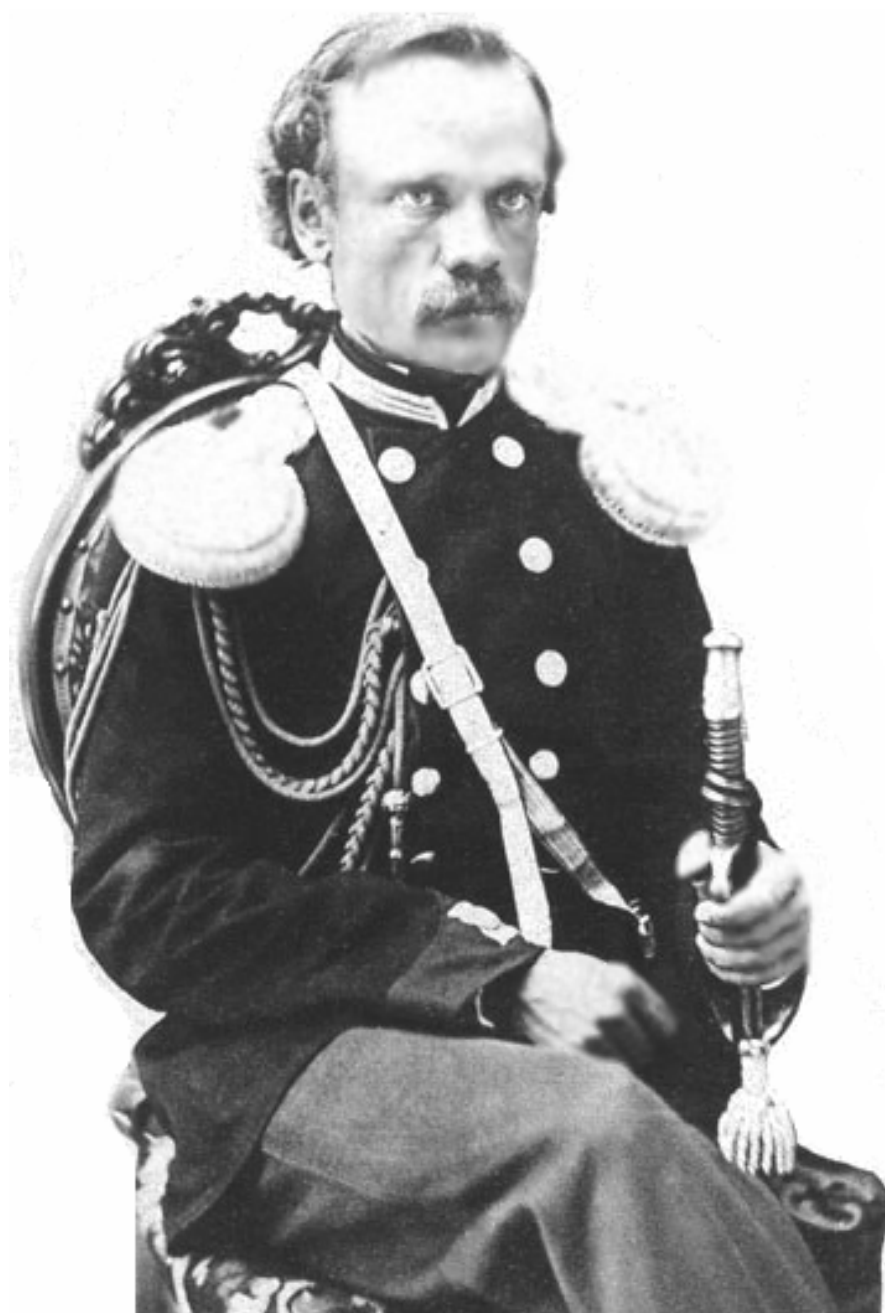
Zygmunt Sierakowski (1827-1863), domena publiczna