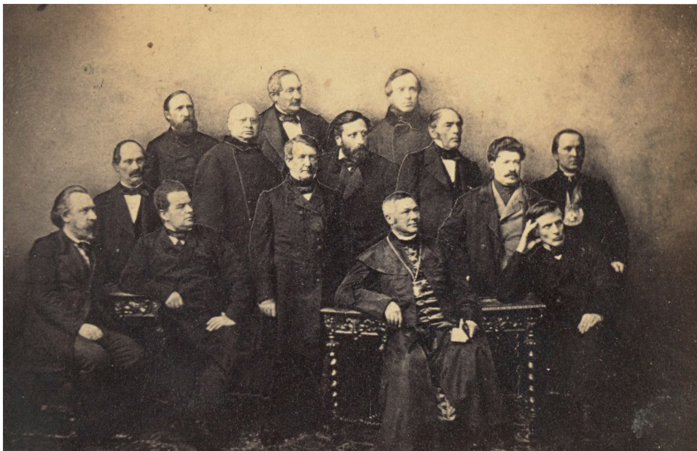
Członkowie Delegacji Miejskiej

3 ■ Delegacja Miejska powstała po stłumieniu patriotycznej manifestacji 27 lutego 1861 r. w Warszawie. Przyjrzyj się fotografii Karola Beyera i przeczytaj poniższy tekst a następnie odpowiedz na pytania.