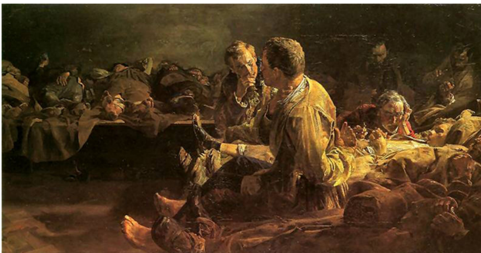
Jacek Malczewski, Śmierć na etapie 1891, Muzeum Narodowe w Poznaniu, domena publiczna

Przeanalizuj treść obrazu i odpowiedz na pytania.