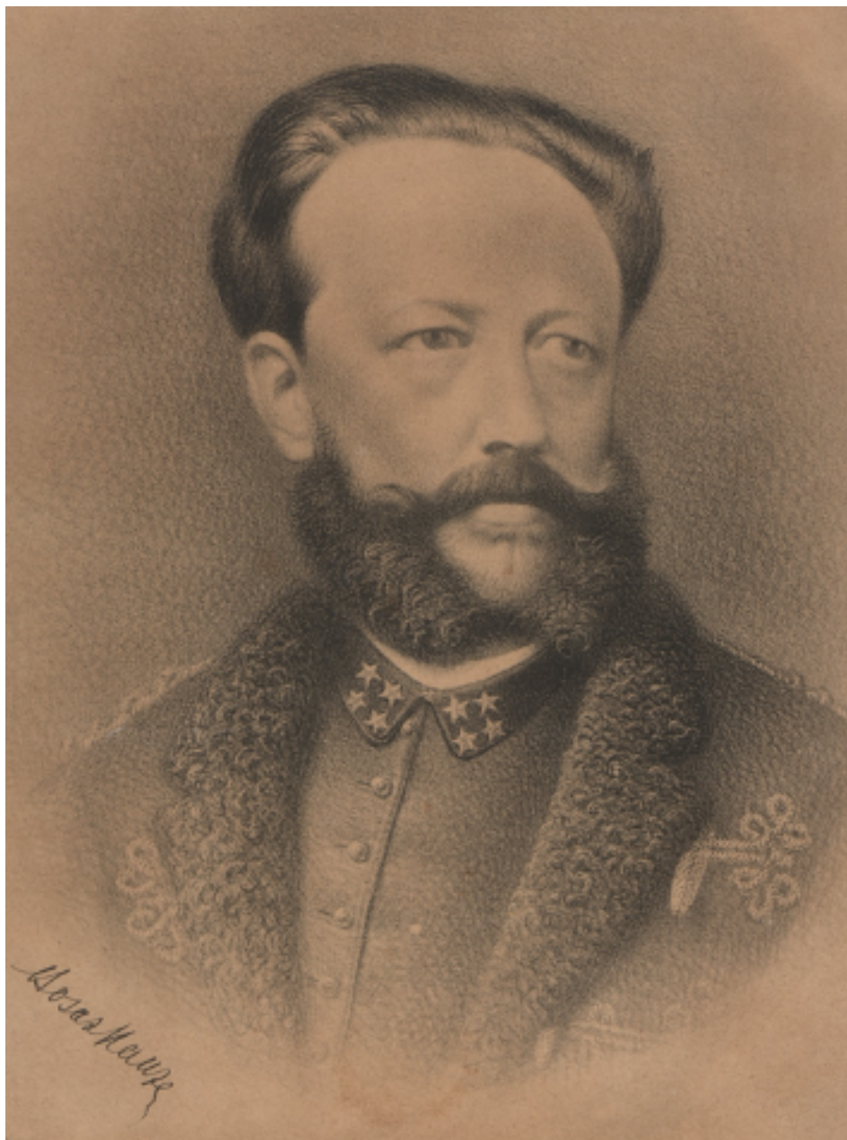
Józef Hauke-Bosak (1834-1871)