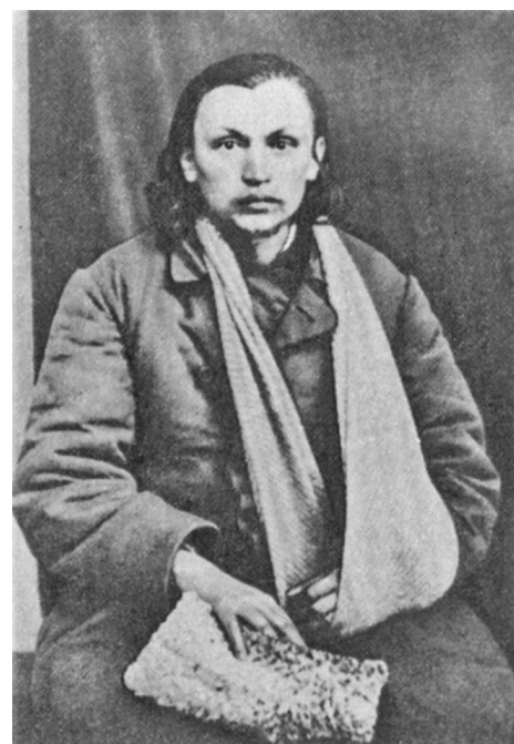
Po lewej: ks. Antoni Mackiewicz (1828-1863), po prawej: ks. Stanisław Brzóska (1832-1865)