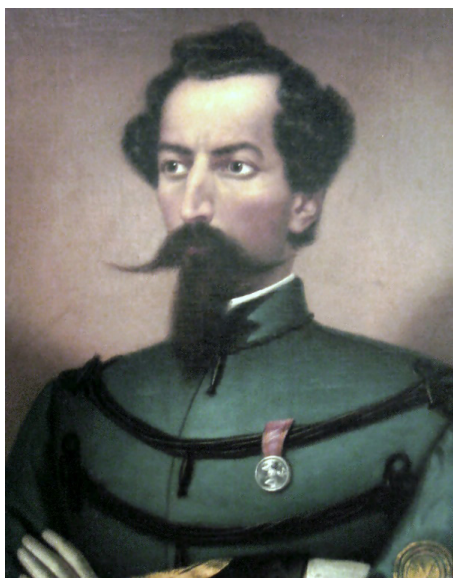
Francesco Nullo (1826-1863), domena publiczna

Duże wrażenie robiła na nim sympatia i szacunek okazywany przez Polaków. Podczas pobytu w Polsce mało się odzywał. Zamiast słów wołał czyny. Był odważny aż do zuchwalstwa i sprawiedliwie oceniał czyny a patriotyzm innych. Włoskiemu pułkownikowi nie podobały się spory toczone przez polityków polskich, niedoskonałości organizacyjne i improwizacja przy organizacji i przerzucie przez granicę wojsk powstańczych. Mimo tego nie wycofał się.