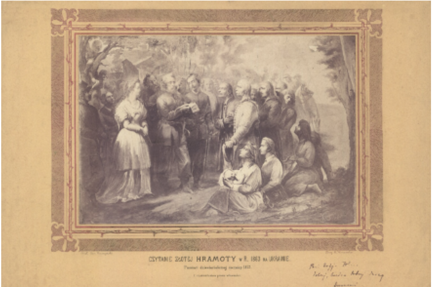
Czytanie Złotej Hramoty , fotografia obrazu Jana Pomiana Kruszyńskiego z 1873 r.

Złota Hramota – dosł. Złota Księga, manifest uwłaszczeniowy Komitetu Centralnego Narodowego w języku ukraińskim (ruskim) z marca 1863 roku, zapowiadający wolność osobistą, swobodę wyznania i nadanie ziemi chłopom ukraińskim, częściowo wydrukowany złotymi literami.